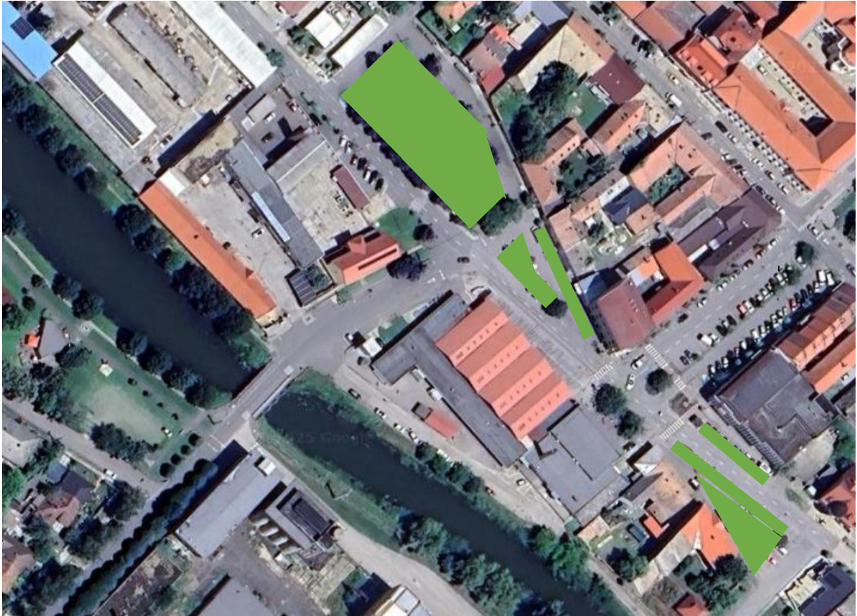
(Híd utca, Búzapiac tér, Rákóczi utca)