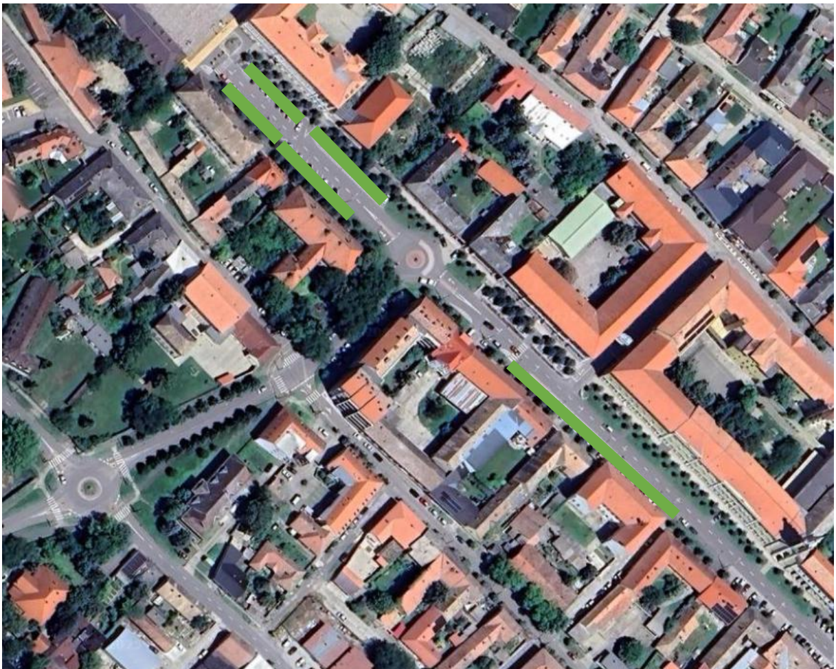
(Szent István király út)