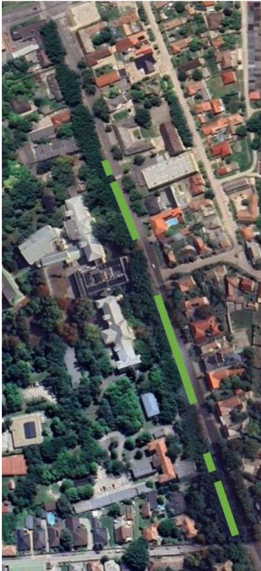
(Kossuth Lajos utca)